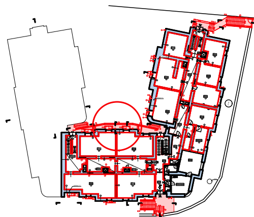
Řez S10 - S10'